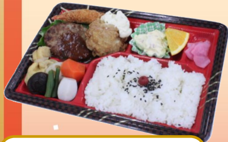
No.301 洋風幕の内 480円