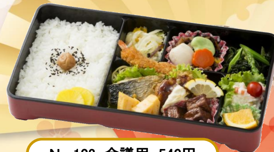
No.103 会議用 540円