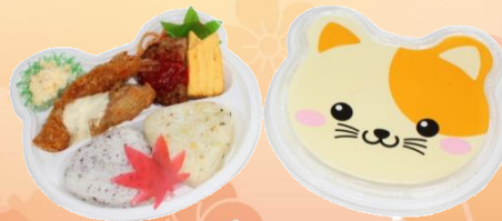
No.303 子供用弁当 350円