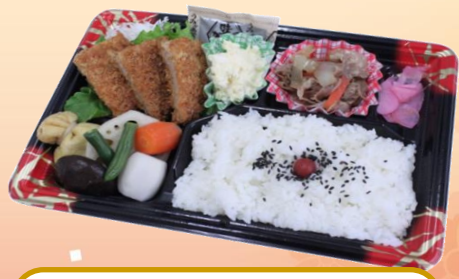
No.302 豚カツ弁当 480円