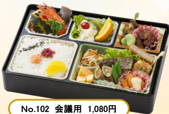
No.102 会議用 1,080円