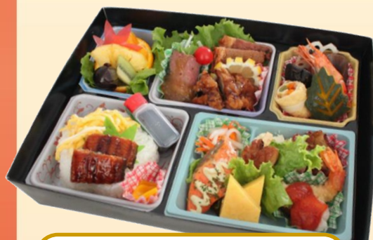
No.201 行楽弁当 1,620円