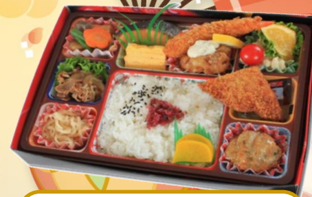
No.204 行楽弁当 648円