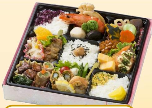
No.202 行楽弁当 1,080円