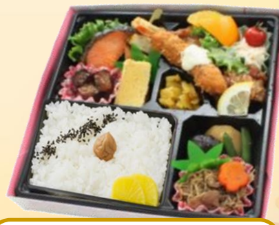
No.203 行楽弁当 864円