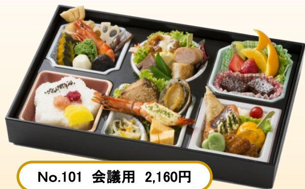
No.101 会議用 2,160円